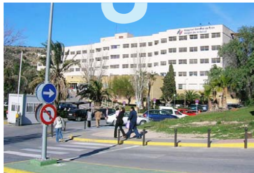
Hospital General de Elda

Sede: AC Hotel ELDA by Marriot Plaza de la Ficia Avda. Chapí, esquina Rosales. 03600 ELDA (Alicante)